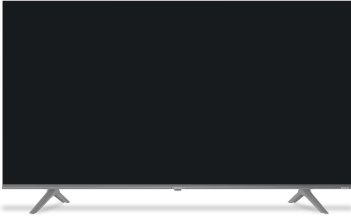
Roku TV 4k/UHD Smart TV