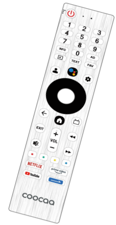
FHD Smart TV