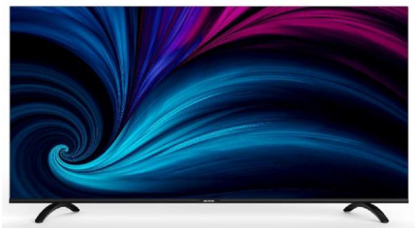
Non Smart TV, HD